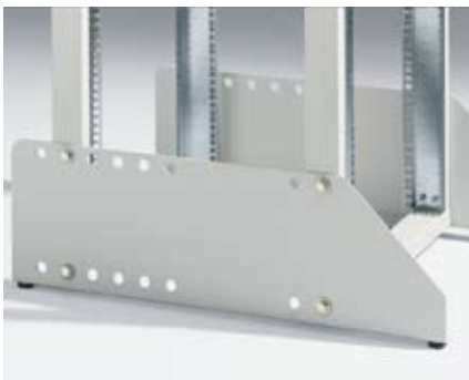
Standfuß mit 50-mm-Raster