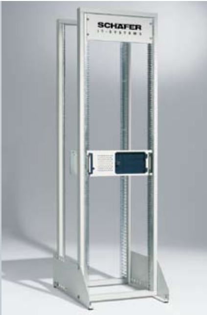
Universalrack (hier: inklusive hinterer 19"-Befestigungsebene)